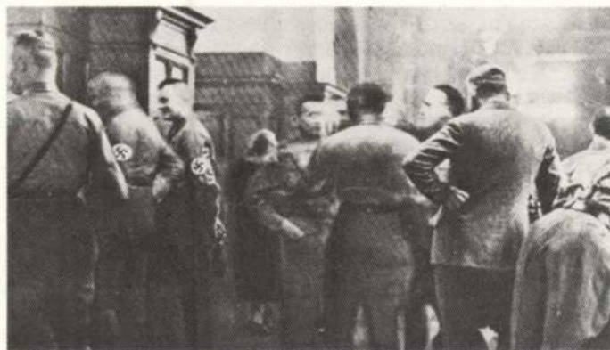
Horogkereszt a Reichstag folyosóján (1930-as évek eleje)

A jobboldalon az ismert szerveződésekre gondolok, ahol igazán komoly szellemi teljesítmények nem születtek. Jellemző módon elsősorban nem magyarországi magyar szerzőknek vannak – nem a Hunnia füzetek és a Magyar Fórum