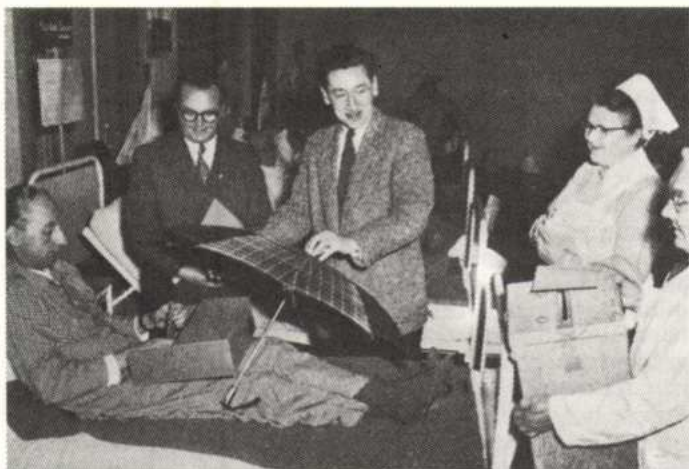
A nyugati demokrácia fellendülése. Parlamenti választás (Berlin, 1954)