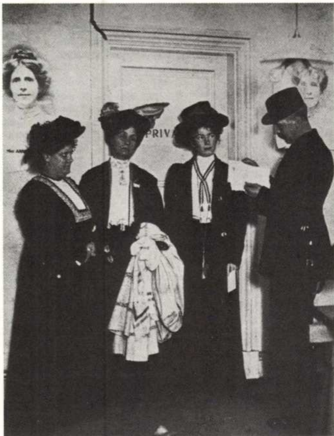
Letartóztatott angol szűfrazsettek az első világháború előtt

P. L.: Megpróbálok én is ilyen rövid lenni. Két kérdést szeretnék feltenni. Az egyik az, hogy szeretnünk kell-e a kapitalizmust? A másik az, hogy meghaladható-e a liberális demokrácia? Én mindkettőre nemmel válaszolnék. Egyrészt